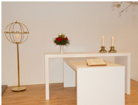
Kirkerummets front er nu komplet med nadverbord og kors i buen over dåbsgraven. Kors og borde er tegnet af Torsten Wang Baungaard og udført af Jesper Jørgensen